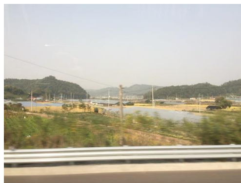
(バスから見た風景)