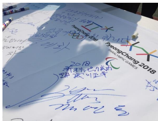
(式典会場内で寄せ書き)