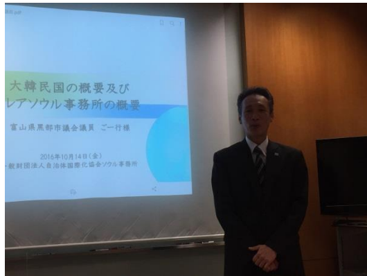
(クレアソウル事務所で研修)